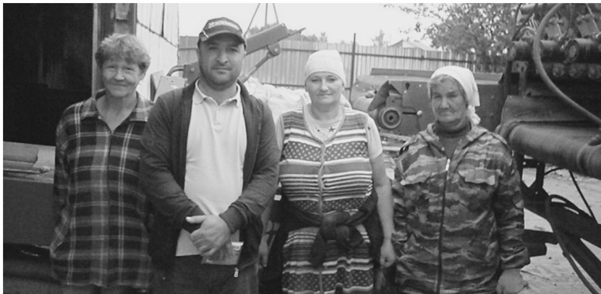
Члены бригады по переборке картофеля.

«Горячая линия» организуется по телефону: 8 (48448) 2-10-45. Время дежурства на «горячей линии» устанавливается следующее: в понедельник-пятница – с 08 час. 00 мин. до 18 час. 00 мин., перерыв с 13 час. 00 мин. до 14 час. 00 мин.; в выходные дни – с 10 час. 00 мин. до 14 час. 00 мин.