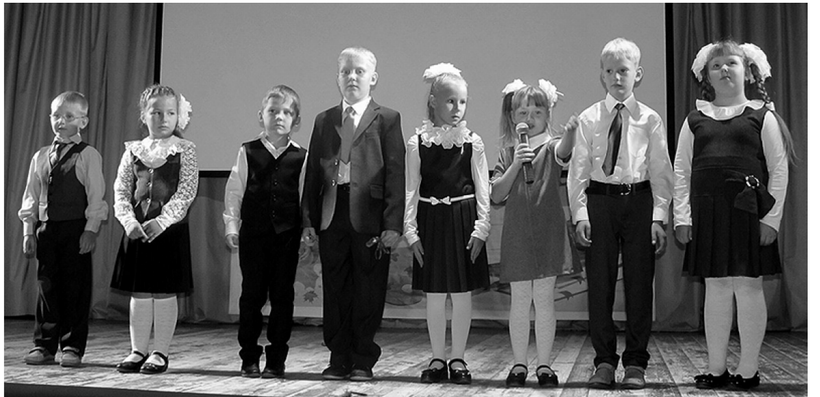
Первоклассники поздравляют учителей с началом учебного года.

26 августа педагогическая общественность района собралась на августовскую конференцию, которая проходила в Доме культуры «Юность» п. Воротынский.